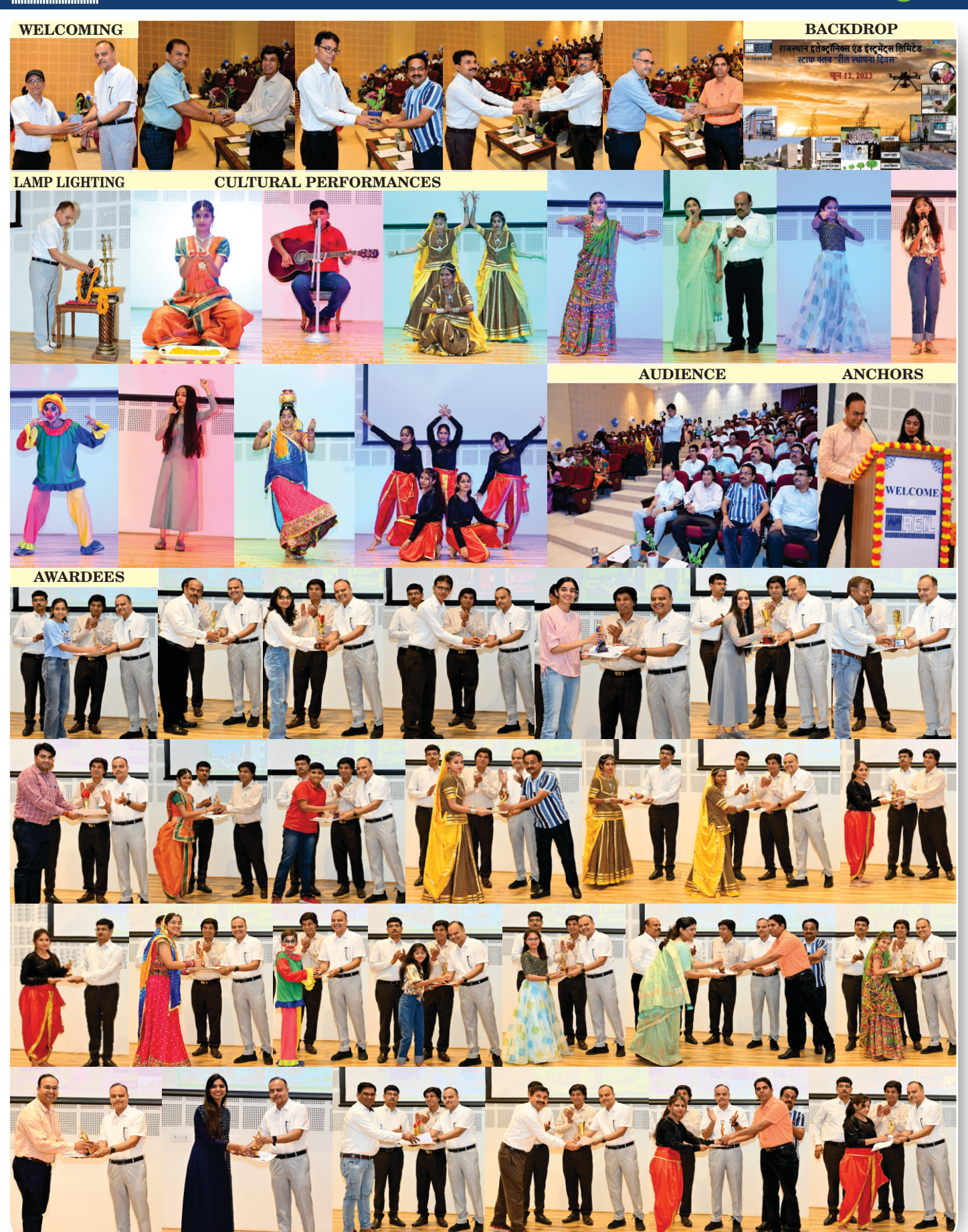
REIL "Shaping Rural India through Electronics, Renewable Energy L IT Solutions"