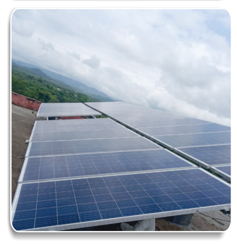
8kWP SPV Power Plant installed at Piplantri Village for powering Water Pumping Systems

An MOU has been signed between Department of College Education, Govt. of Rajasthan and Rajasthan Electronics & Instruments Limited (REIL) for "Design, Supply, Installation & Commissioning of Grid connected SPV Power Plant in various Government Colleges including maintenance for the period of five years for cumulative 2830 kWp Grid connected SPV Power plants".